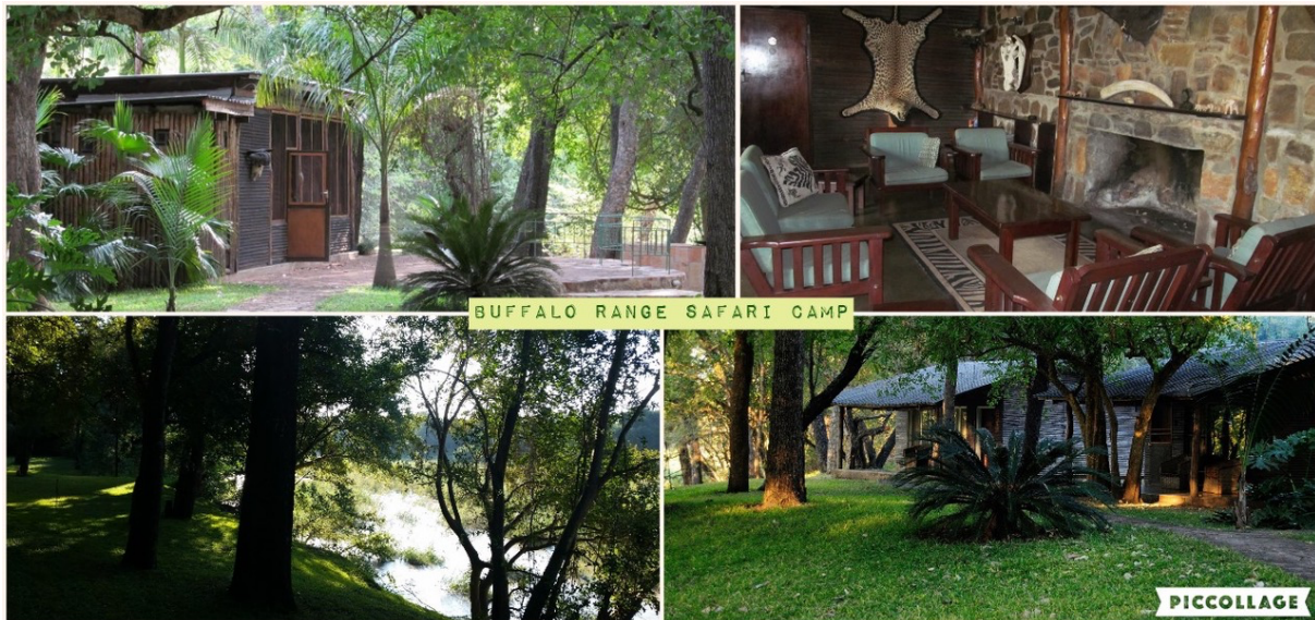
Chiredzi River Camp

Hegegemeinschaft zusammengeschlossen. Es sind riesengroße, gut gehegte wildreiche klassische Safari-Areas. Die Chiredzi River Conservancy (CRC) liegt ca. 450 km östlich von Bulawayo unweit der Grenze zu Mosambik. Etwas südöstlich davon ist der Gonarezhou-Nationalpark.