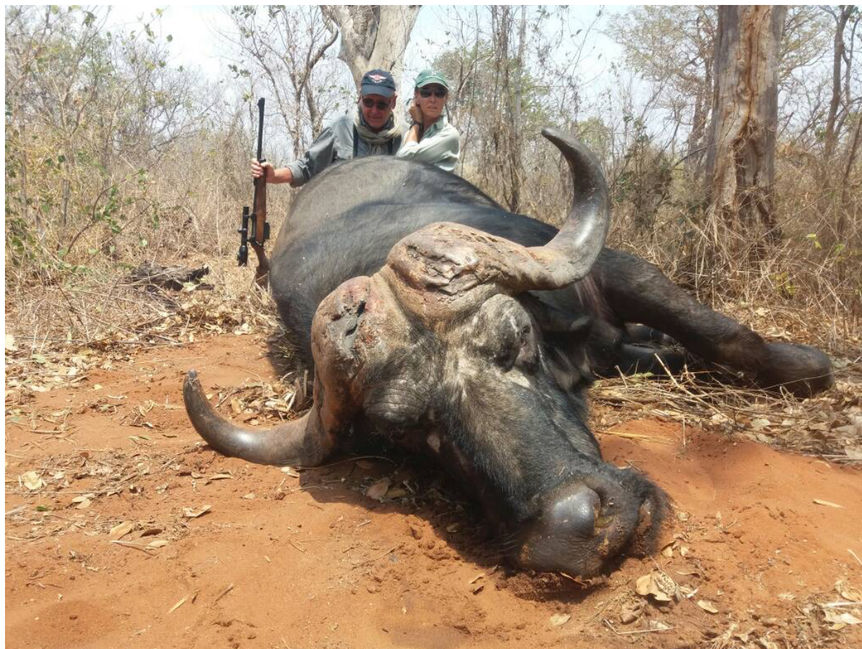
Reifer alter Kaffernbüffel

Deshalb machen wir Ihnen anschließend Beispiele für Safaris auf Büffel. Wenn Sie weitere Wildarten bejagen wollen, bitten wir um entsprechende Wünsche und bieten Ihnen dann solche Safaris individuell an. Es ist alles möglich, Elefant, Löwe, Leopard, Büffel, Flußpferd, Krokodil, Großer Kudu usw. Grundsätzlich ist jede Wildart zu gleichen Abschussgebühren bejagbar. Ausnahmen sind Elefanten und Büffel, bei denen sich die Abschussgebühr nach der Trophäenstärke richtet. Die besten Monate für Safaris in Chiredzi sind April bis November, obwohl z.B. Kaffernbüffel Standwild sind.